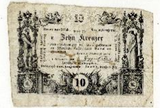
obr. 14) Bankovy uložené v Národním archivu Praha - složka Benediktini