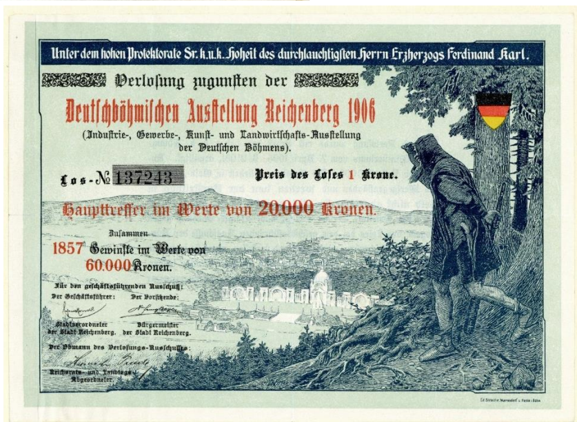
obr.15) Losy uložené v Národním archivu Praha - složka Benediktini